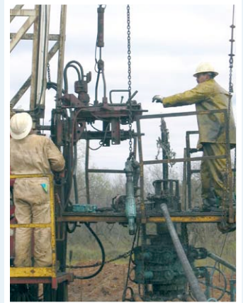
Här pågår renovering av en gammal brunn i östra Texas. Man ersätter alla gamla sönderrostade rör med nya friska rör.